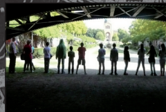
Workshops auf Anfrage